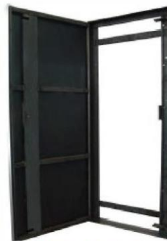
PUERTA MODELO B ABIERTA