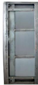
PUERTA MODELO B PARTE TRASERA

Email: info@mcpuertas.com Teléfono: 644 842 404